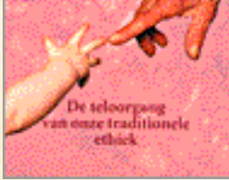
De teloorgang van onze traditionele ethiek

tussen dood en leven – de teloorgang van onze traditionele ethiek.