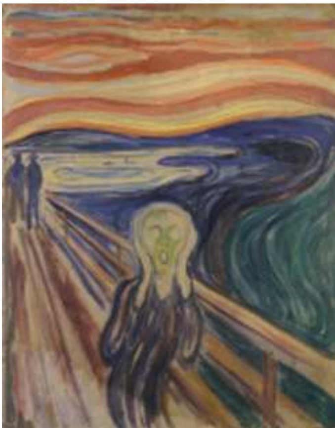
Schilderij: De Schreeuw van Edvard Munch, Museum Munch Oslo. http://www.munch.museum.no

Omne illud verum est, quod clare et distincte percipitur (René Descartes)